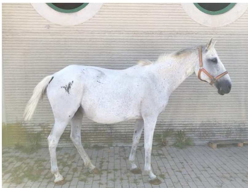
Bien 2: XOCA. Microchip 724098100387018