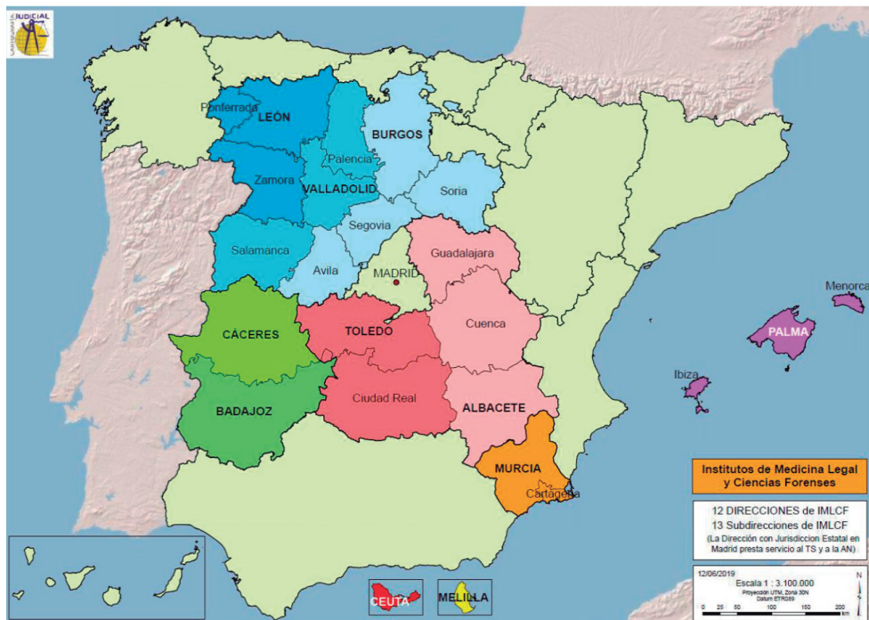
Ilustración 2. Mapa de IMLCF e UVFI del Ministerio de Justicia.